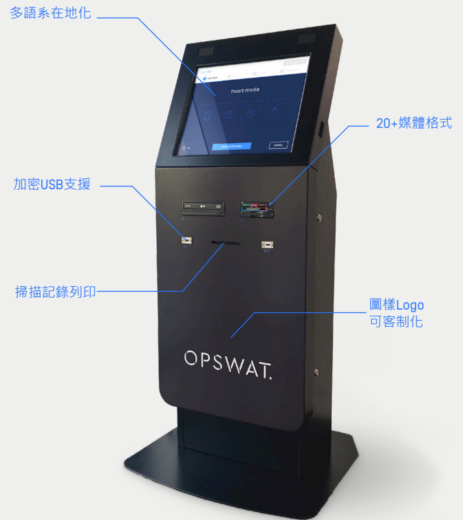
Kiosk model K3000 [depicted] available only in the U.S. MetaDefender Kiosk 具備多種機型 了解更多資訊，請洽台灣區代理商

MetaDefender Kiosk 讓您能信任所有需進入或離開安全環境的可攜式儲存媒體。